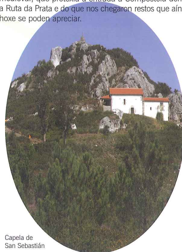
Capela de San Sebastián

No mesmo cumio do Pico ergueuse un torreón medieval, que protexía a entrada a Compostela dende a Ruta da Prata e do que nos chegaron restos que aínda hoxe se poden apreciar.