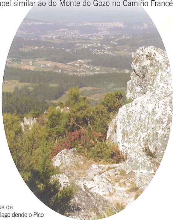
Vistas de Santiago dende o Pico

Dende a Ruta da Prata o Pico Sacro marca a derradeira etapa, sendo o primeiro lugar dende onde se ven as ansiadas torres da catedral compostelá, cumprindo así un papel similar ao do Monte do Gozo no Camiño Francés.