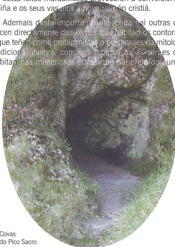
Covas do Pico Sacro

Ademais desta importantísima lenda hai outras que nacen directamente das xentes que habitan os contornos e que teñen como protagonistas a personaxes da mitoloxía tradicional galega, como os mouros ou as serpes que habitan nas misteriosas covas que hai preto do cumio.